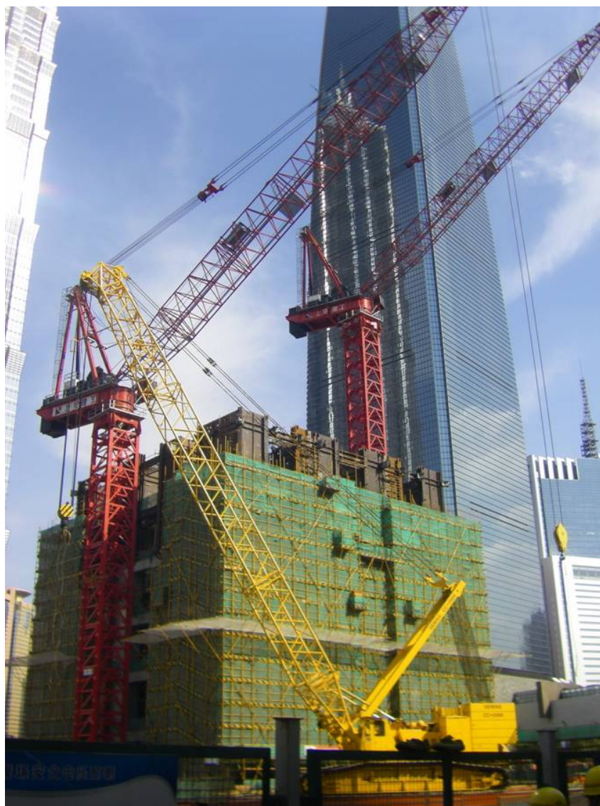
Рисунок 4 – Строительство первых этажей здания Shanghai Tower (г. Шанхай, Китай)

Здание запроектировано американской компанией и выполнено из сталебетонного каркаса. В основу положены американские нормы с учетом требований норм Китая по нагрузкам, безопасности и пр. Объект был полностью запроектирован и разработана детальная технология строительства с учетом инженерно-геологических параметров площадки и стесненных условий строительства. В ходе посещения стройки и беседы со специалистами удалось выяснить, что проектирование и разработку технологии ведут параллельно и неотделимо друг от друга. К строительству приступают только после разработки и проверки независимыми организациями-экспертами всей проектной и технологической документации. Очень тщательно выполняют фундаменты и подземную часть сооружения. К возведению каркаса здания приступают только после устройства и контроля качества всего фундамента, представляющего собой свайное поле из буронабивных свай, объединенных жесткой фундаментной плитой. Количество свай – 3000 штук, длина свай – 89 м, диаметр свай – 1,0 м, расстояние между сваями в осях – 3,0 м, толщина плиты – 3,0 м (рис. 4). Подземные этажи здания будут возводить по технологии "сверху – вниз". Предполагаемый общий срок строительства с 2008 г. по 2014 г. В здании применяются в основном материалы и конструкции китайского производства. Рабочие и ИТР на стройплощадке – китайцы. Мы и дальше будем внимательно следить за этой стройкой.