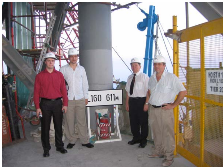
Рисунок 6 – Специалисты РУП "Институт БелНИИС" на 160 этаже башни Бурж Дубай (отметка 611 м)

Строительство небоскреба велось непрерывно в две смены по 12 часов с использованием самых передовых технологий. Высокомарочная бетонная смесь подавалась при помощи бетононасосов на высоту 611 м, что является абсолютным мировым рекордом. Распалубка монолитных конструкций осуществлялась через 10 часов. Эти показатели достигались за счет применения комплекса химических модификаторов бетона, состав которых фирмы нам не раскрыли.