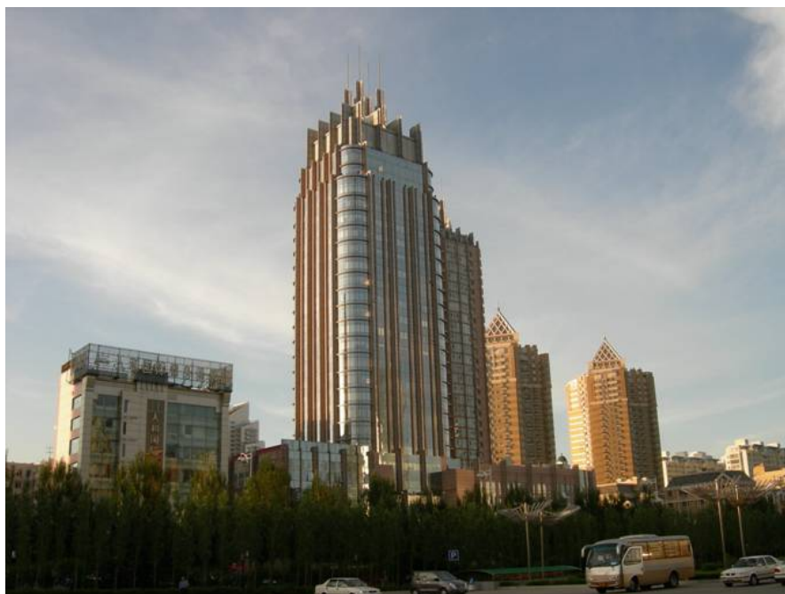
Рисунок 2 – Высотное здание в г. Харбин (Китай)

Проектирование и строительство самых высоких зданий в Китае разрешено лишь двум фирмам: Шанхайской и Пекинской строительным компаниям. Китай начал осваивать высотное строительство с совместного с иностранными компаниями (в основном США) проектирования и возведения подобных зданий. В настоящее время опыт Китайской Народной Республики позволяет самостоятельно осуществлять большую программу строительства жилых и административных зданий в высотном исполнении.