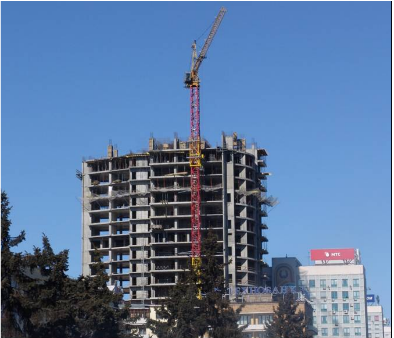
Рисунок 9 – Строительство первого высотного здания Административно-торгового центра высотой 130 м по проспекту Победителей, 7 в г. Минске (март, 2011 г.)

Учитывая важность и актуальность высотного строительства для нашей страны по заданию Министерства архитектуры и строительства Республики Беларусь в РУП "Институт БелНИИС" выполняется комплекс научно-исследовательских работ, такие как: