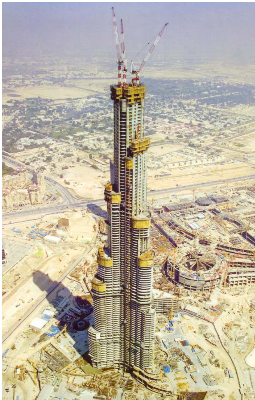
Рисунок 5 – Строительство башни Бурж Дубай высотой 818 м (г. Дубай, ОАЭ)

Проект The Burj Tower разработали архитекторы и инженеры фирмы Skidmore, Owings & Merrill (г. Чикаго, США). Автор проекта — Эдриан Смит. Заказчик строительства — компания Emaar Properties PJSC. Строительство небоскреба осуществляли: Samsung (Республика Корея), Besix (Бельгия) и Arabtec JV (ОАЭ). Об уникальности The Burj Tower, не имеющего аналогов в мире, можно судить по его основным характеристикам: общая высота с металлическим шпилем — 818 м, высота железобетонного здания — 643,3 м, количество этажей — 164, общая площадь — 344 000 м 2 [6].