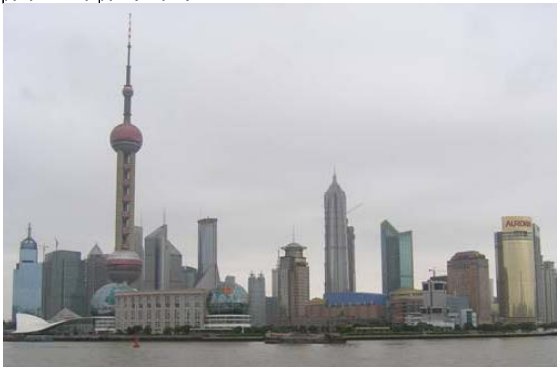
Рисунок 1 – Небоскребы на реки Хуанпу в г. Шанхае (декабрь, 2010 г.)

Китай уделяет значительное внимание этому виду строительства. В мегаполисах, таких как Шанхай, Пекин, Харбин и др. упор сделан на строительство небоскребов из монолитного железобетона (рис. 1 и 2). Следует отметить, что в ряде регионов Китая сейсмичность может достигать 8-9 баллов. В этих условиях каркас из монолитного железобетона ведет себя прогнозируемо и обеспечивает устойчивость зданий при неблагоприятных сейсмических воздействиях. Проектирование и строительство небоскребов контролируется государством. Очень высокие требования предъявляются к квалификации и опыту персонала фирм, задействованных в проектировании и строительстве.