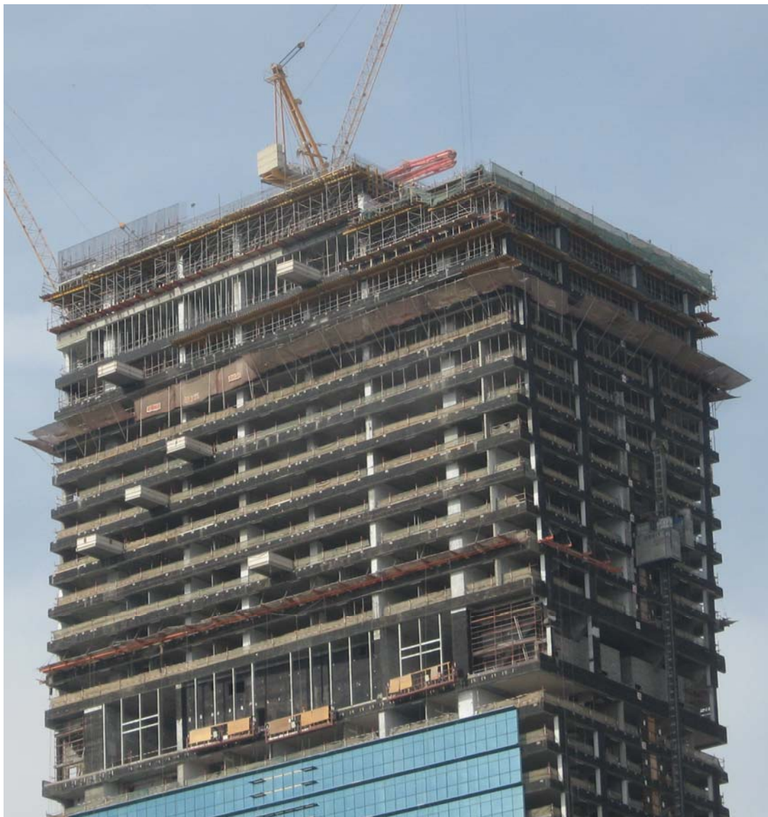
Рисунок 8 – Технологическая "одежда" при строительстве небоскреба (г. Дубай)

С целью нормализации и упорядочения системы разработки, согласования и утверждения СТУ Министерство архитектуры и строительства Республики Беларусь поручило специалистам РУП "Институт БелНИИС", Научно-исследовательского института пожарной безопасности и чрезвычайных ситуаций Министерства по чрезвычайным ситуациям Республики Беларусь и РУП "Стройтехнорм" разработать ТКП 45-1.01-... "Специальные технические условия в области архитектуры и строительства. Порядок разработки, построения, изложения, согласования и утверждения" [9]. Разработка документа завершена в 2010 г. Технического кодекс установившейся практики распространяется не только на высотные сооружения, но и на сложные, экспериментальные объекты, на которые отсутствуют нормы проектирования. В соответствии с этим документом СТУ разрабатываются организациями, уполномоченными Министерством архитектуры и строительства Республики Беларусь и Министерством по чрезвычайным ситуациям Республики Беларусь. Для высотных зданий и сооружений из монолитного железобетона уполномоченной организацией является РУП "Институт БелНИИС". Для разделов СТУ содержащие противопожарные требования к объектам уполномоченной организацией является НИИ ПБ и ЧС МЧС РБ. Эти две организации уже имеют опыт совместной разработки СТУ для ряда проектируемых высоток в г. Минске и ряд СТУ находится в разработке.