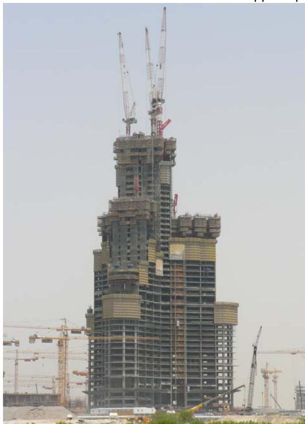
Рисунок 7 – Технология возведения монолитного каркаса башни Бурж Дубай

Разработке технологии строительства столь высокого здания уделялось не меньше внимания, чем его проектированию. Высокие темпы строительства диктовали требования к самой конструкции каркаса. Фрагмент опалубочной технологии возведения башни приведен на рисунке 7. Мы благодарны фирме BESIX за предоставленную возможность воочию ознакомиться с выдающейся стройкой.