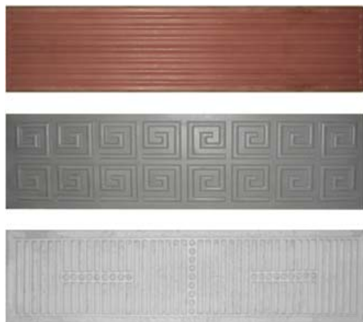
Рисунок 3. Внешний вид экспериментальных образцов (сверху вниз: образец №1, образец №2, образец №3)

На основе результатов компьютерного моделирования были изготовлены экспериментальные образцы. Внешний вид образцов представлен на рисунке 3.